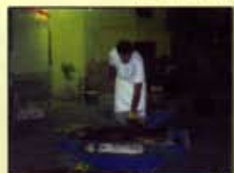
Sopar Churrasco 2007