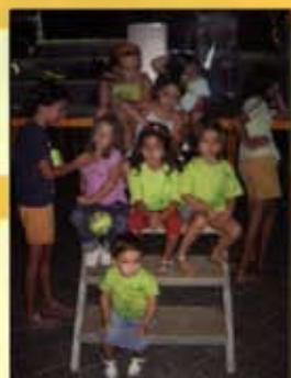
Teatro Infantil 2007