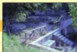
Font de Partegat