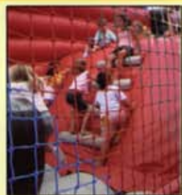
Parque Infantil 2007