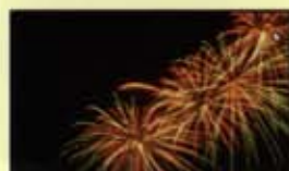
Castell de Focs 2007